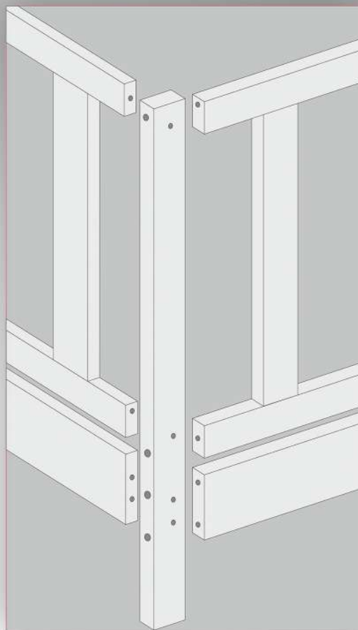
Узел сборки 2