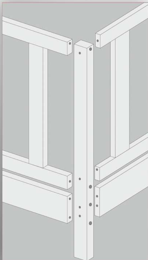
Узел сборки 3