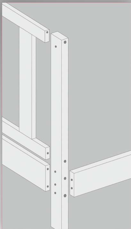
Узел сборки 1